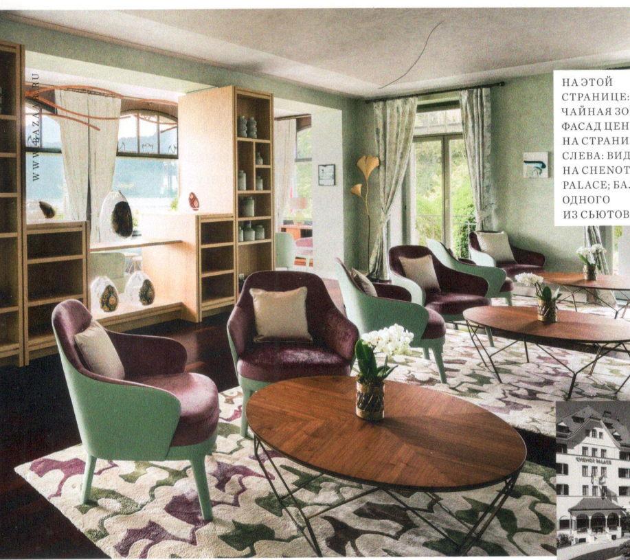
НА ЭТОЙ СТРАНИЦЕ: ЧАЙНАЯ ЗОНА; ФАСАД ЦЕНТРА. НА СТРАНИЦЕ СЛЕВА: ВИД НА CHENOT PALACE; БАЛКОН ОДНОГО ИЗ СЬЮТОВ.