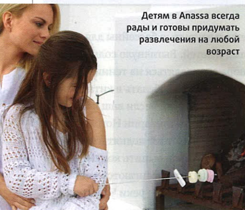
Детям в Anassa всегда рады и готовы придумать развлечения на любой возраст