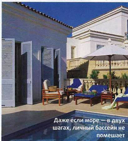
Даже если море — в двух шагах, личный бассейн не помешает

помощью все необходимое для ребенка — от памперсов до ходунков — можно заказать уже при бронировании номера и, прихватив лишь свое чадо, отправляться в отпуск налегке. Кроме того, в Anassa работает детский клуб, куда принимают даже самых юных членов — от четырех месяцев, разумеется, под чутким присмотром здешних нянь. Ну а родители в это время могут наведаться, например,