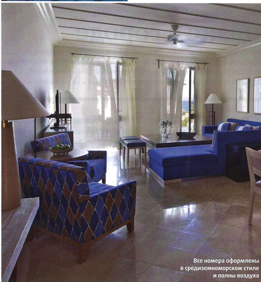
Все номера оформлены в средиземноморском стиле и полны воздуха