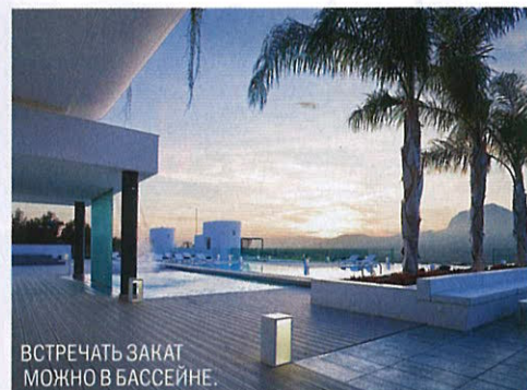
ВСТРЕЧАТЬ ЗАКАТ МОЖНО В БАССЕЙНЕ.

Я люблю книги по коучингу и менеджменту. Например, Дейла Карнеги, Уэйна Дайера, Стивена Кови, Дэниела Гоулмана. Они не только увеличивают объем моих знаний, но и помогают реально использовать их в жизни.