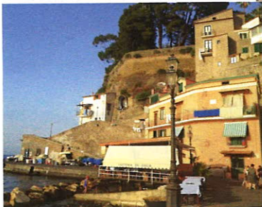
СЛЕВА: ВИД НА СЕМЕЙНЫЙ РЕСТОРАН TRATTORIA DA EMILIA.

«Когда в Trattoria da Emilia (via Marina Grande, 62) заканчивается свежая рыба, привезенная утром, ресторан закрывается. Так что пусть вас не смущает простота обстановки: еда здесь – самая лучшая».