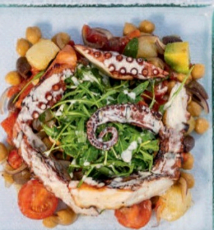
ОСЬМИНОГ НА ГРИЛЕ С ГУАКАМОЛЕ

ВСЕ БЛЮДА В DUKLEY SEAFRONT RESTAURANT ГОТОВЯТ НА ОТКРЫТОЙ КУХНЕ – ГАСТРОНОМИЧЕСКАЯ МЕДИТАЦИЯ В ЧИСТОМ ВИДЕ.