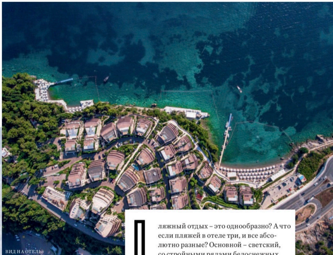
ВИД НА ОТЕЛЬ