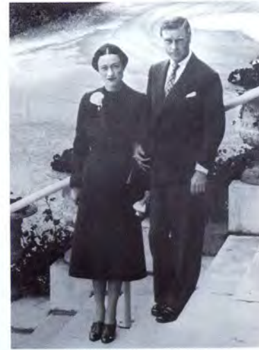
Снимки 1948 г.: знаменитый бассейн, вырезанный в скале; аллея, ведущая от отеля к морю — она и сейчас выглядит так же; частный причал у Eden Roc. Герцог и герцогиня Виндзорские в Hotel du Cap, 4 апреля 1938 г.