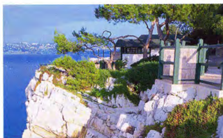
Дань традициям — пляжные «кабана»