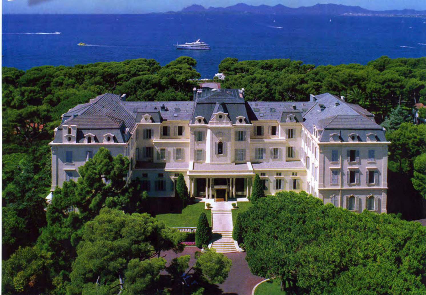
Фасад отеля Hotel du Cap Eden Roc; сверху: рекламный плакат курорта 1940-х гг.