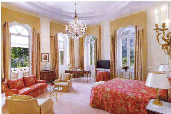
Отличия нового Junior suite — в деталях

Низкий сезон — от €490; высокий сезон — от €680, Антиб, Boulevard J. F. Kennedy, +33 4 93 61 39 01, hotel-du-cap-eden-roc.com