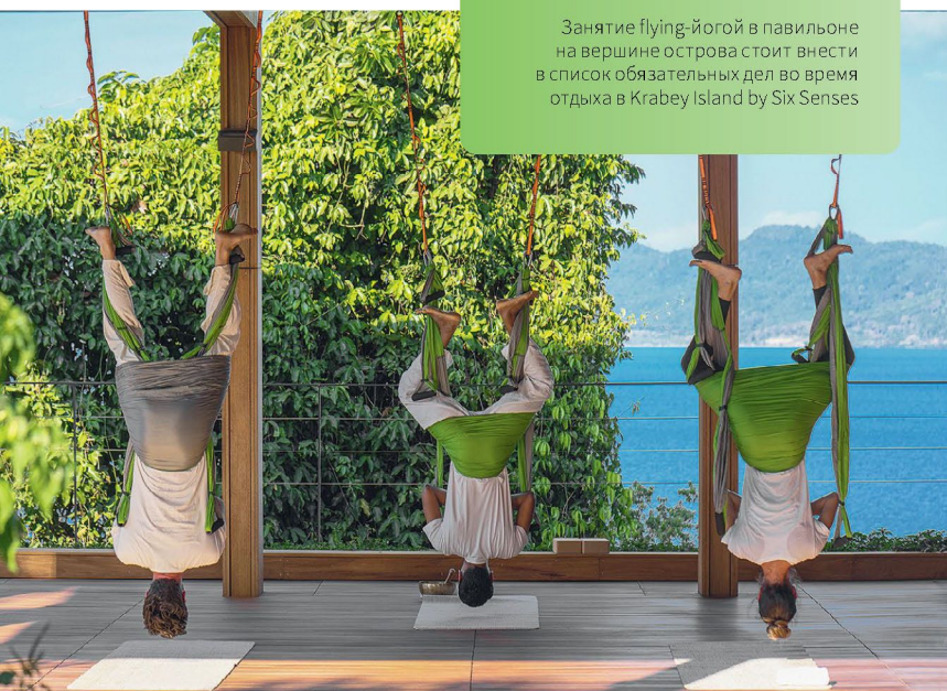
Занятие flying-йогой в павильоне на вершине острова стоит внести в список обязательных дел во время отдыха в Krabey Island by Six Senses

Из таких отелей, как Krabey Island by Six Senses, никогда не хочется уезжать. Примиряет с этой мыслью только то, что тут вы обретете новые силы для ежедневных забот. А на прощание обязательно загадайте заветное желание у 105-летнего баньяна — символа острова. YHAG