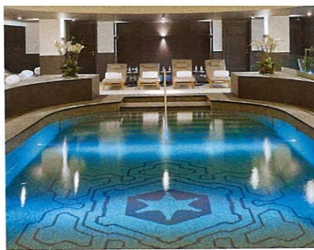
СЛЕВА: СПА-ЗОНА. ВНИЗУ: ВИД ОТЕЛЯ.