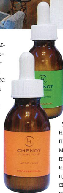
Массажные масла Actif Yang и Actif Detox, CHENOT COSMÉTIQUE.