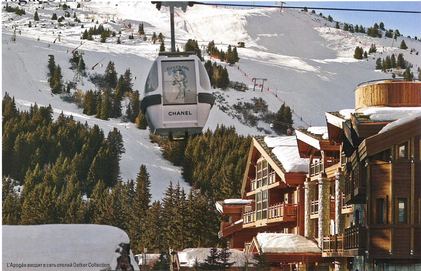
L'Apogée входит в сеть отелей Oetker Collection