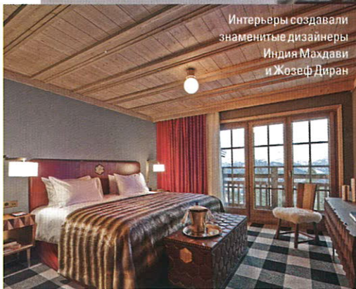
Интерьеры создавали знаменитые дизайнеры Индия Махдави и Жозеф Диран