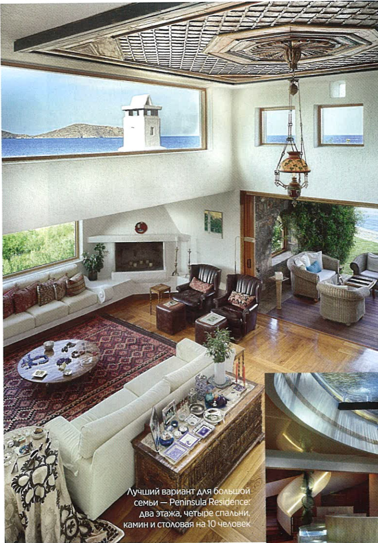
Лучший вариант для большой семьи — Peninsula Residence: два этажа, четыре спальни, камин и столовая на 10 человек