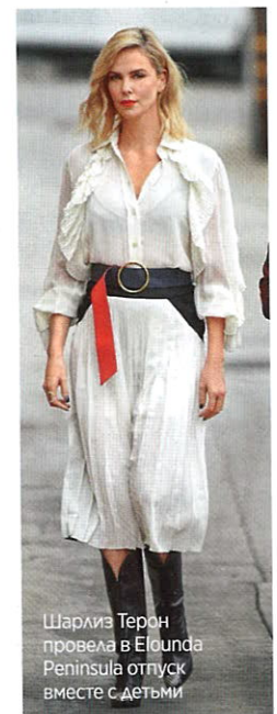
Шарлиз Терон провела в Elounda Peninsula отпуск вместе с детьми

Отказ от курения благодаря электро-акупунктуре достигается в 85 % случаев (€ 310).