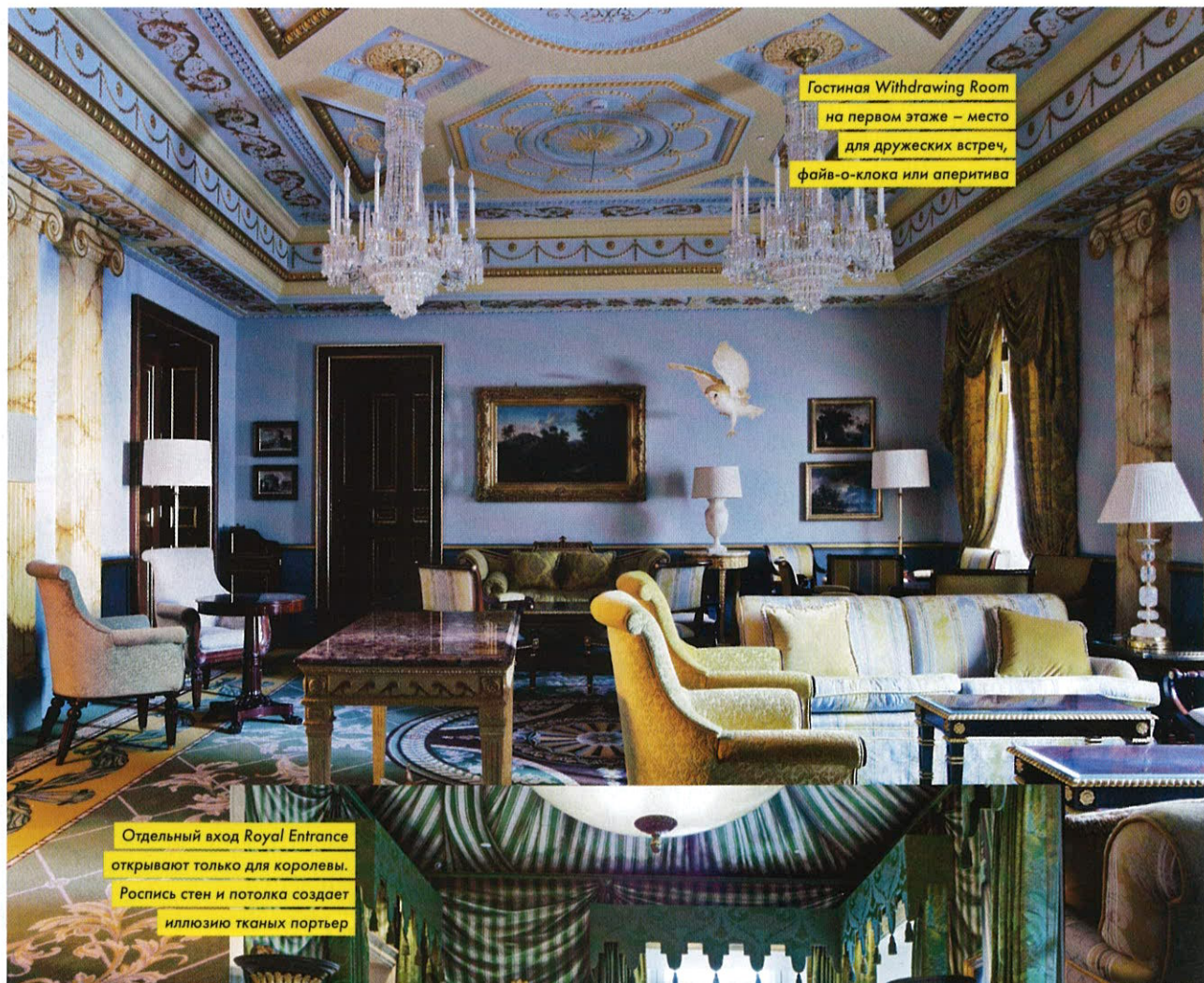
Гостиная Withdrawing Room на первом этаже – место для дружеских встреч, файв-о-клока или аперитива