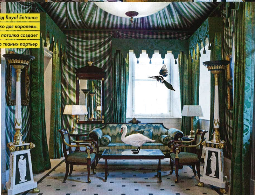
Отдельный вход Royal Entrance открывают только для королевы. Роспись стен и потолка создает иллюзию тканых портьер

хитектуры, остались нетронутыми. Основные изменения коснулись интерьеров, которые в соответствии с концепцией Пинто должны создавать ощущение, что вы приехали погостить к потомственному английскому аристократу. В дом с расписанными вручную стенами и потолками, золотой патиной, изготовленными на заказ тканями и мебелью, где у каждой комнаты (а в The Lanesborough 49 номеров и 44 сьюта) – своя атмосфера и колорит. Сегодня факсы сменились планшетами, а двери номеров открывают смарт-карты. Однако, несмотря на все технические достижения, главным достоянием все равно остаются люди – дворецкие (они приставлены не только к сьютам, но и ко всем номерам), консьержи и портье, словно из сериала «Аббатство Даунтон».