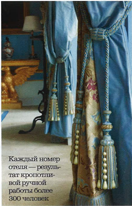
Каждый номер отеля — результат кропотливой ручной работы более 300 человек