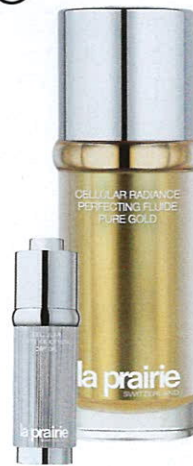
Флюид Cellular Radiance Perfecting Fluid Pure Gold ; сухое масло Cellular Swiss Ice Crystal Dry Oil . Все La Prairie .