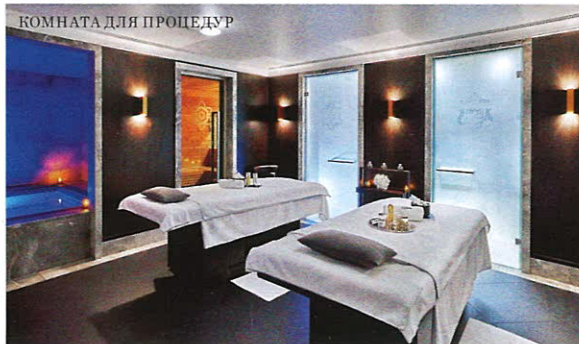
КОМНАТА ДЛЯ ПРОЦЕДУР