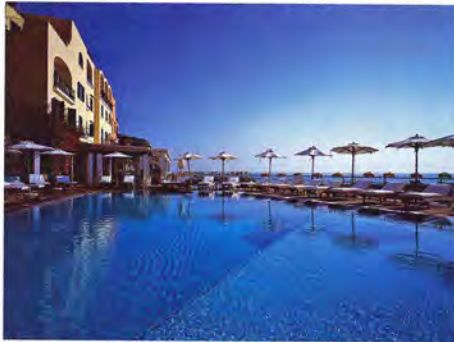
Открытый бассейн с морской водой