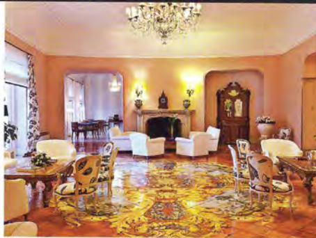
Каминный зал в L'Albergo della Regina Isabella

В самом маленьком населенном пункте Искьи, Лакко-Амено, расположен один из самых известных спа-отелей острова и всей Италии. L'Albergo della Regina Isabella славен не только многочисленными знаменитыми постояльцами (в списке постоянных гостей значились Ричард Бартон и Элизабет Тейлор, Мария Каллас и Альберто Сорди), но и горячими термальными источниками, которые посещала некогда королева Изабелла.