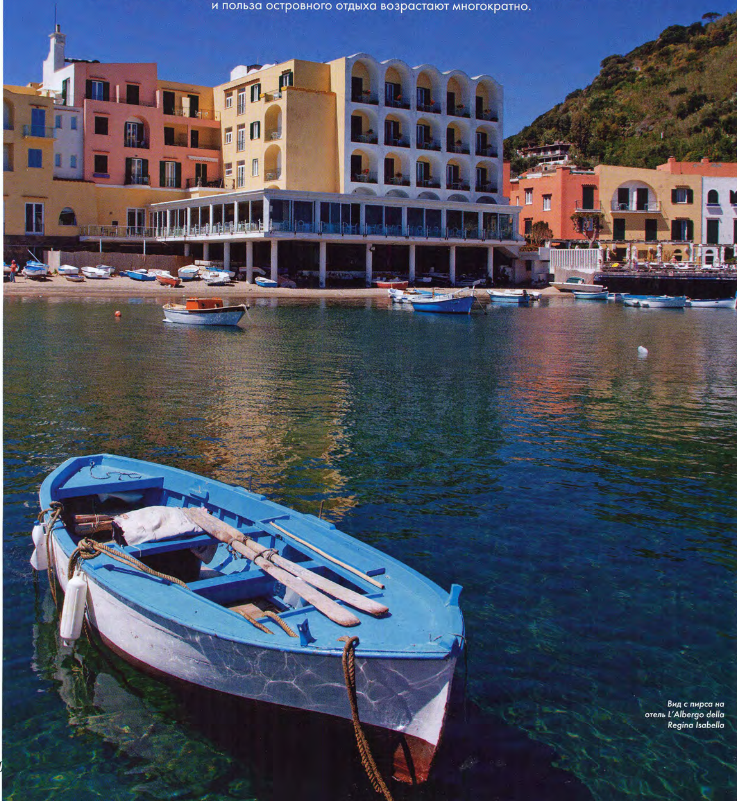
Вид с пирса на отель L'Albergo della Regina Isabella

Целебные термальные источники Искьи известны с незапамятных времен. В сочетании со знаменитым отелем, гурмэ-рестораном и индивидуально подобранными продуктами для спа-процедур удовольствие и польза островного отдыха возрастают многократно.