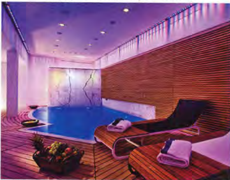
Бассейн с термальной водой и хромотерапией

напротив отеля. (Наибольшим спросом пользуется стол для двоих, стоящий в уединении на самом краю пирса, – лист ожидания может дать фору некоторым мишленовским ресторанам.)