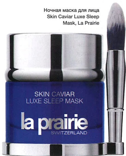
Ночная маска для лица Skin Caviar Luxe Sleep Mask, La Prairie