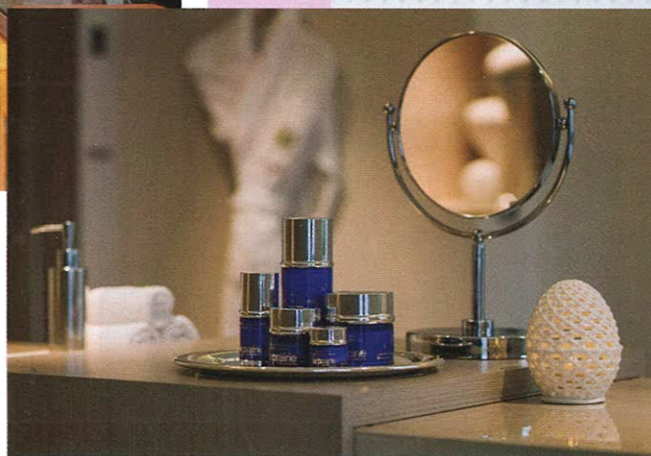
Все процедуры в спа-центре направлены на омоложение и снятие стресса