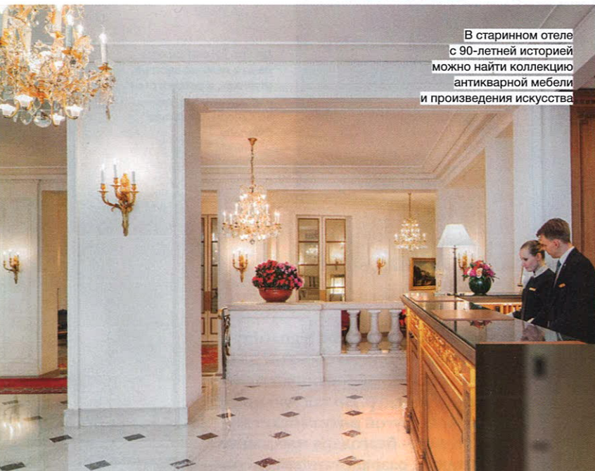
В старинном отеле с 90-летней историей можно найти коллекцию антикварной мебели и произведения искусства