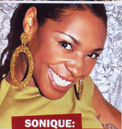
SONIQUE: I FEEL GOOD!