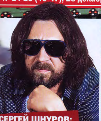
СЕРГЕЙ ШНУРОВ: ПРОСТ, КАК РУБЛЬ

БЛИЖЕ К ЗВЕЗДАМ № 24-25 (46-47), 28 декабря 2006