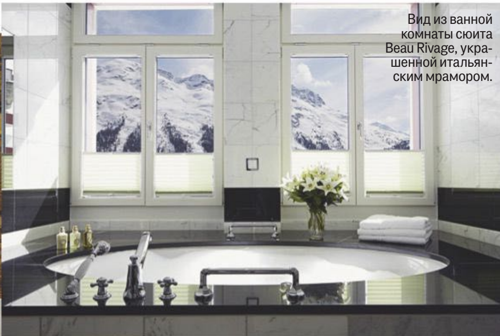
Вид из ванной комнаты люксы Beau Rivage, украшенной итальянским мрамором.