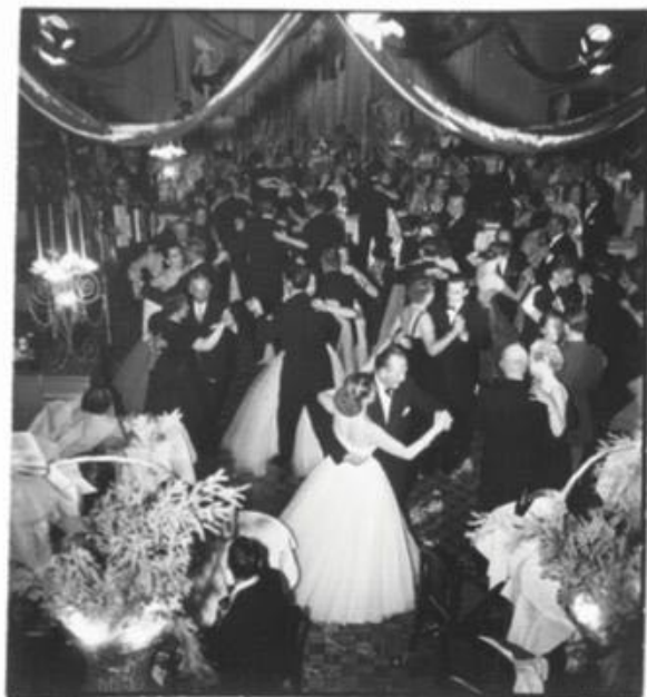
На балу по случаю открытия отеля присутствовала королева Великобритании.