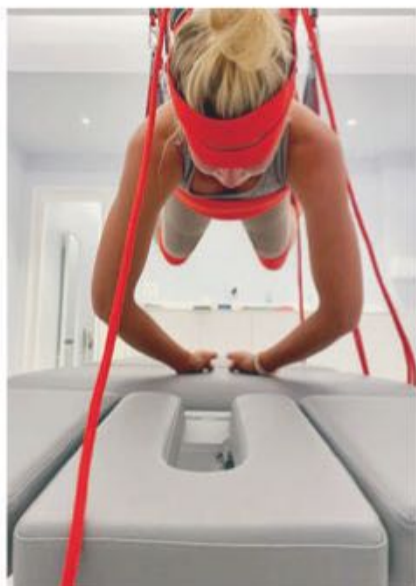
Виктория Манасир (Vikiland) на сеансе Neuras.