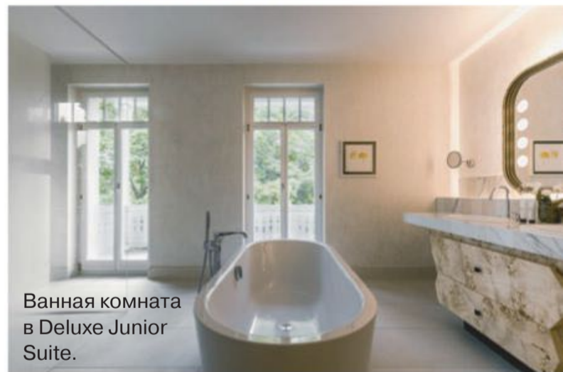
Ванная комната в Deluxe Junior Suite.