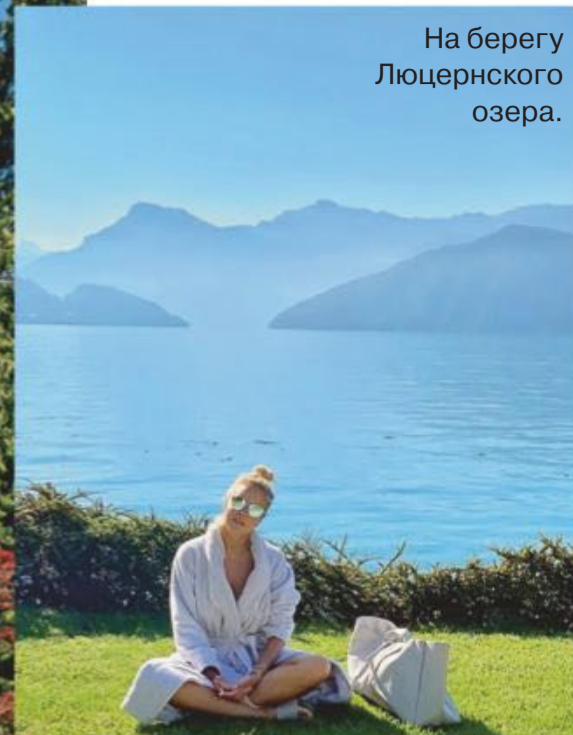
Chenot Palace Weggis.