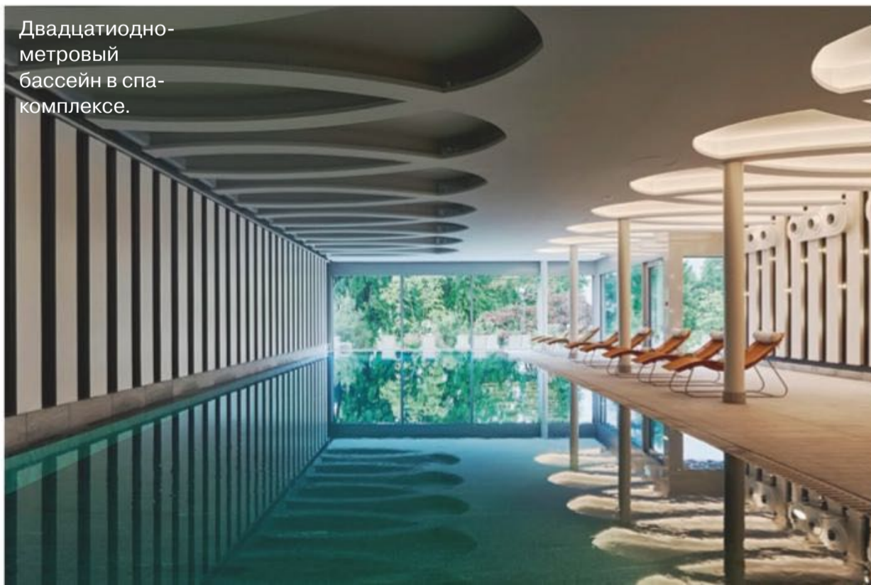
Двадцатиметровый бассейн в спа-комплексе.