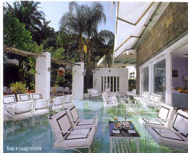
Бар в саду отеля