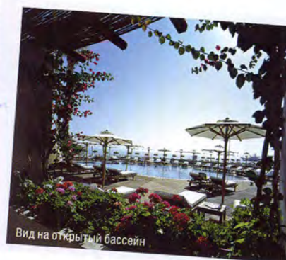
Вид на открытый бассейн

Всего на острове Искья более семидесяти действующих термальных источников, известных еще с античных времен. Некоторые из них выходят прямо на морское побережье – здесь можно купаться даже зимой.