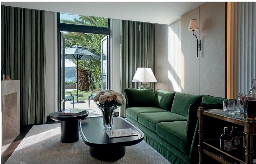
ПЛОЩАДЬ НОМЕРОВ КАТЕГОРИИ MAISONNETTE BOSPHORUS СОСТАВЛЯЕТ 75 КВ. МЕТРОВ, У БОЛЕЕ КАМЕРНЫХ НОМЕРОВ — 30 И 55 КВ. МЕТРОВ. В КАЖДОМ ЕСТЬ КАМИН И ОБЯЗАТЕЛЬНЫЙ ПАНОРМНЫЙ ВИД НА ПРОЛИВ.

Б осфор, который заглядывает прямо в окна, крики чаек, проходящие мимо тяжелые баржи и паромы — Vakko Hotel & Residence Sumahan Bosphorus дает редкую возможность увидеть Стамбул вне шумных улиц туристического центра с его бурлящей энергией, погрузившись в размеренный созерцательный отдых. Если первый отель Vakko Hotel & Residence турецкой фэшн-империи Vakko предлагает апартаменты в духе европейских столиц в модном Нишанташи, новый проект сети кажется его полной противоположностью. Расположенный в уважаемом районе Ченгелькёй в азиатской части города, камерный Sumahan Bosphorus напоминает скорее загородную резиденцию, как ее мог бы изобразить главный турецкий писатель современности Орхан Памук.