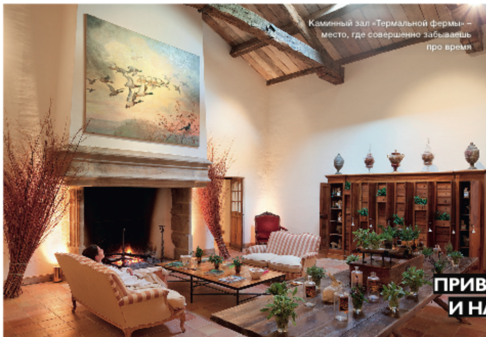
Каменный зал «Термальной фермы» – место, где совершенно забываешь про время