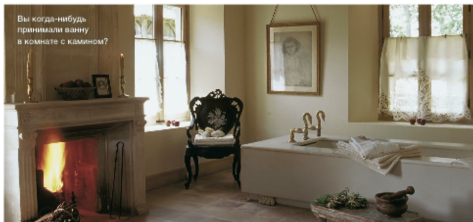
Вы когда-нибудь принимали ванну в комнате с камином?

Не менее важную роль на курорте играет питание. За кухню, в том числе и диетическую, в Les Prés d'Eugénie отвечает Мишель Герар – классик французской гастрономии, который сохраняет статус обладателя целых трех звезд «Мишлен» на протяжении вот уже 39 лет (где вы еще таких встретите?). Он не только прекрасно разбирается в haute cuisine, но и может похвастаться собственной методикой похудения не в ущерб вкусу. Ее он разработал, тщательно изучив основы правильного питания. В главном ресторане курорта Michel Guérard,