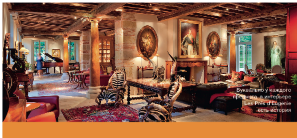
Букалльно у каждого предмета в интерьере Les Prés d'Eugénie есть история!

По мнению Кристины Герар, другой важный для восстановления организма фактор – красота во всех проявлениях. И она будет окружать вас повсюду. Удивительный старинный парк, опоясывающий курорт, декоративный огород и розарий, которые так и хочется запечатлеть на фото. Антикварная мебель и много солнечного света в номерах. Атмосферные и не похожие друг на друга рестораны, блюда – словно произведения искусства. И вдобавок – расположенные по соседству виноградники семьи Герар с классическим шато! Будьте уверены: оказавшись среди этой красоты, вам сразу захочется забыть о проблемах, расслабиться и с удовольствием заниматься лишь собой! Текст: Наталия Кузнецова