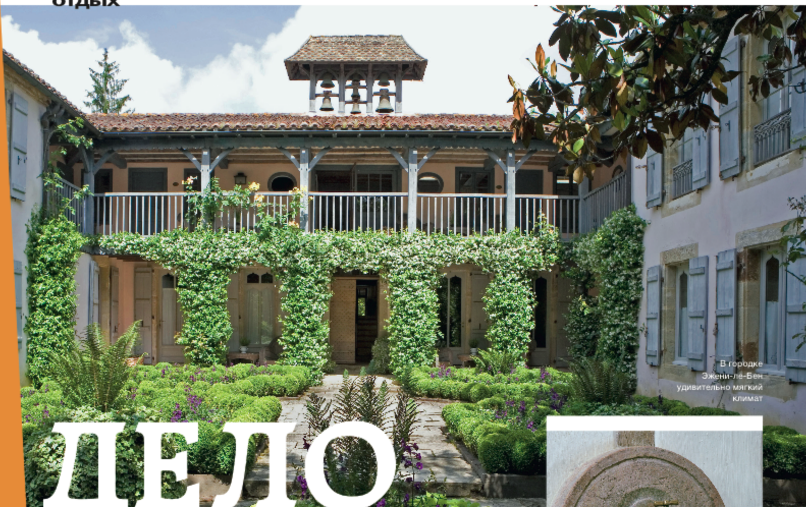
В городке Эжени-ле-Бен удивительно мягкий климат