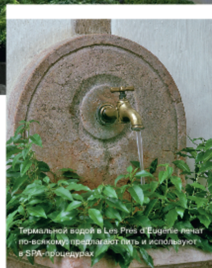
Термальной водой в Les Prés d'Eugénie печат по-всякому предлагают пить и используют в SPA-процедурах

Мечтаете о вкусных ужинах без ущерба для фигуры? Отправляйтесь во Францию! Там, в Ландах, на курорте Les Prés d'Eugénie за диету гостей отвечает знаменитый мишленовский шеф Мишель Герар, разработавший особую методику похудения!