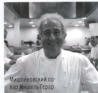
Мишленовский повар Мишель Герар