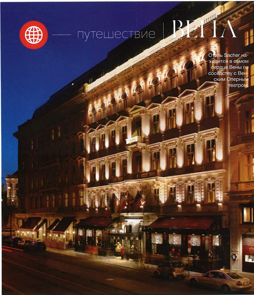
Отель Sacher находится в самом сердце Вены по соседству с Венским Оперным театром.