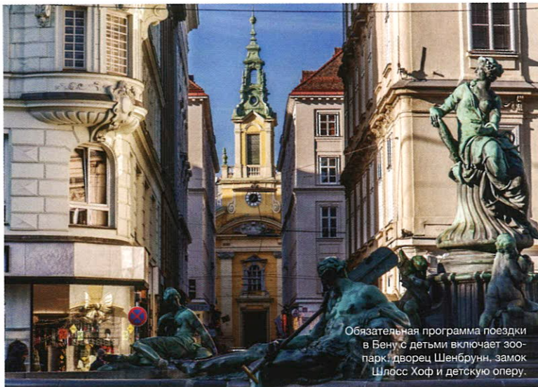
Обязательная программа поездки в Вену с детьми включает зоопарк, дворец Шенбрунн, замок Шлосс Хоф и детскую оперу.

В отеле Sacher в Вене футуризм современных технологий, обеспечивающих пятизвездочный комфорт, сочетается с полутора-вековой историей, бережно оберегаемой владельцами.