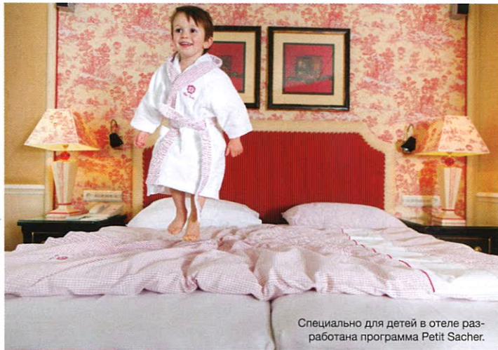
Специально для детей в отеле разработана программа Petit Sacher.

ОЧЕНЬ ВАЖНЫЕ ПЕРСОНЫ Программа «Маленький Sacher» подготовлена с большой заботой и вниманием к юным постояльцам отеля. Так, по приезду всех детей ждет приветственный подарок и путеводитель Petit Sacher, красочный персональный гид по отелю с плюшевым медвежонком Францем. В номере маленьких гостей ждут халаты, тапочки, набор для купания «без слез», подборка фильмов по возрасту, люлька или дополнительная детская кроватка, радионяня, подогреватель для бутылочек, стульчик для кормления и детское питание. Также через консьержа можно заказать детскую стирку и пригласить няню на то время, пока родители захотят выйти вдвоем прогуляться по вечерней Вене или послушать оперу.