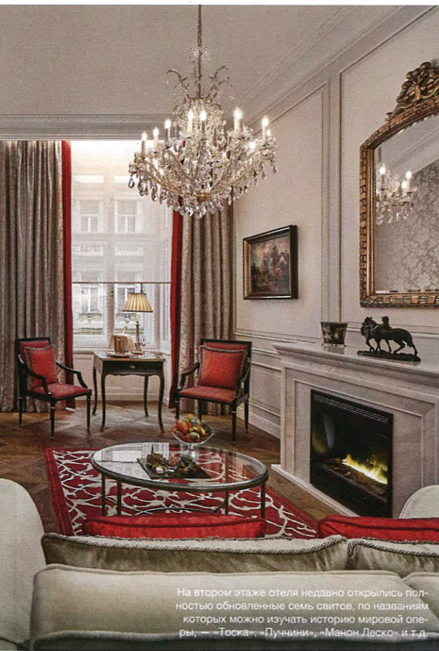
На втором этаже отеля недавно открылись полностью обновленные семь свитов, по названиям которых можно изучать историю мировой оперы. — «Тоска», «Пуччини», «Манон Леско» и т. д.