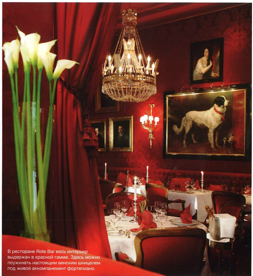
В ресторане Rote Bar весь интерьер выдержан в красной гамме. Здесь можно поужинать настоящим венским шницелем под живой аккомпанемент фортепиано.