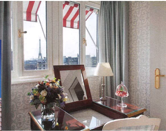
Из сюжета Josephine Baker открывается роскошный вид на Эйфелеву башню и крыши Парижа