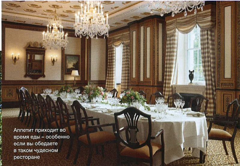
Аппетит приходит во время еды – особенно если вы обедаете в таком чудесном ресторане