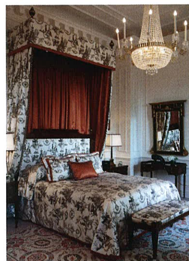
В таких интерьерах можно с полным правом чувствовать себя королевской особой

Если вы хотите действительно почувствовать, что такое Лондон, я рекомендую вам The Lanesborough. ☺