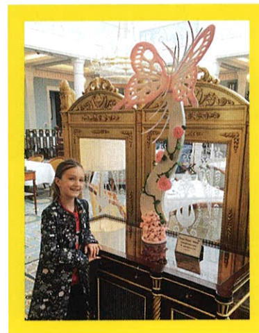
Дочери, как и мне, The Lanesborough пришелся по вкусу

свободная минутка. А иногда удастся и совместить приятное с полезным – например, командировку и каникулы дочери. Конечно же, мне хочется, чтобы она полюбила Лондон так же, как и я, и обязательно дружила с детьми моих друзей.