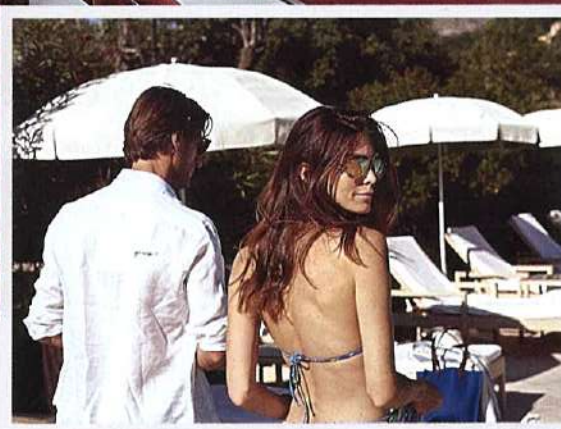
Вариантов проведения досуга в Du Domain Saint-Martin множество, так что лучше сразу планировать поездку на неделю, а то и две

Новые отели появляются на карте мира чуть ли не каждый день и чаще всего похожи друг на друга, как братья. Совсем другое дело – отели с историей, сокровищами или даже привидениями. Yachting изучил все и выбрал самые интересные.