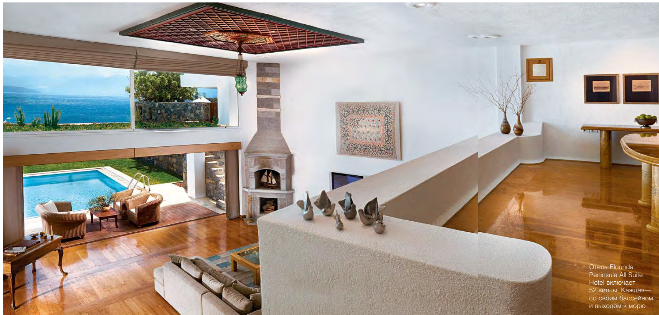
Отель Elounda Peninsula All Suite Hotel включает 52 виллы. Каждая—со своим бассейном и выходом к морю