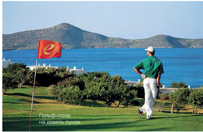
Гольф-поле на девять лунок