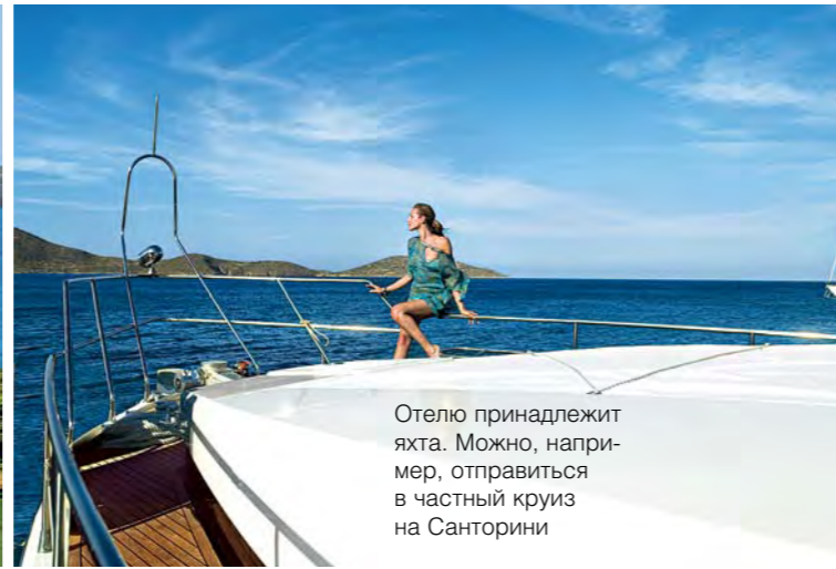
Отелю принадлежит яхта. Можно, например, отправиться в частный круиз на Санторини