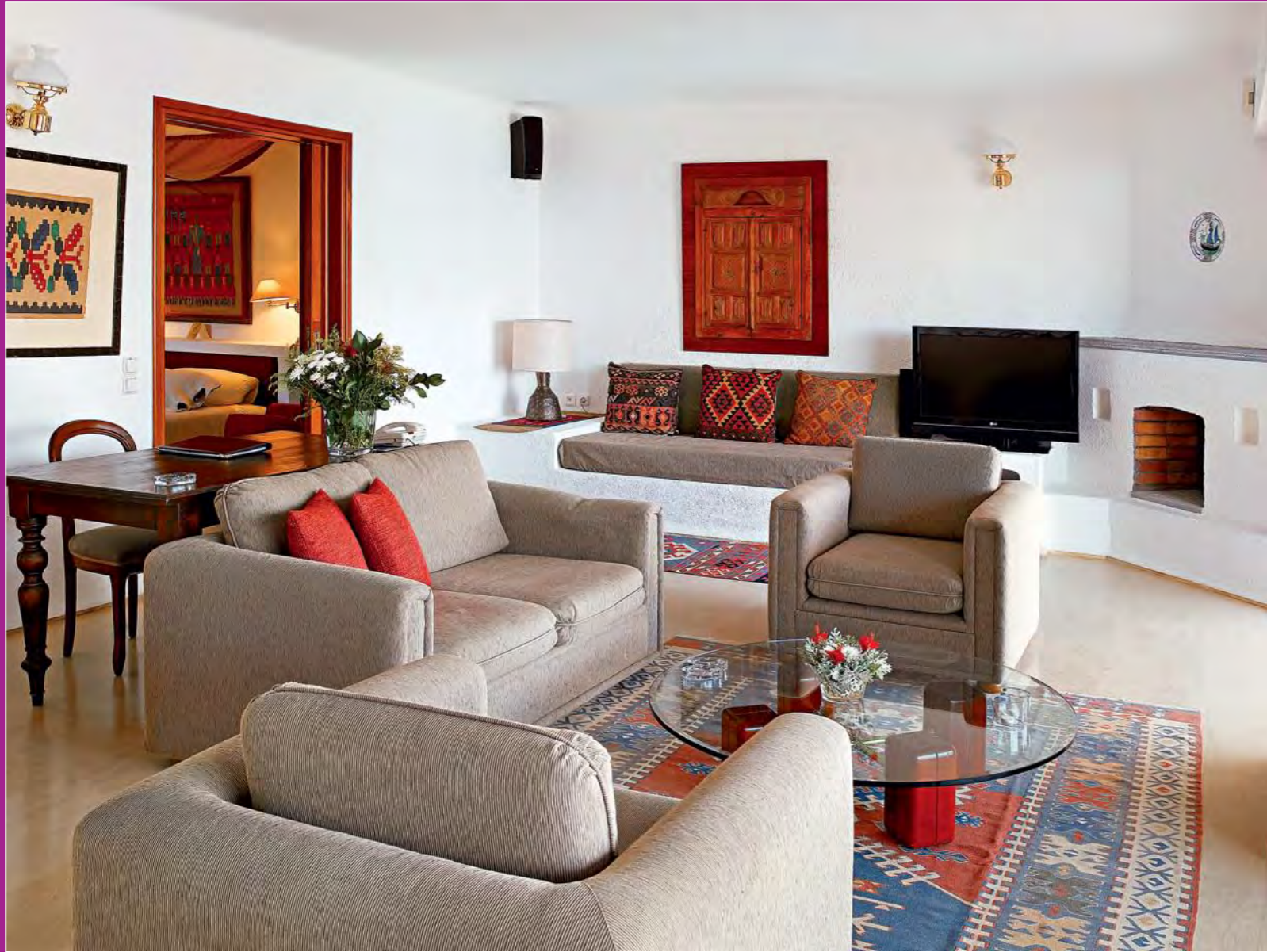
Гостиная сюта Superior в отеле Elounda Mare

Внизу Номер в отеле Elounda Mare; частный бассейн с видом на море (отель Peninsula All Suite Hotel)