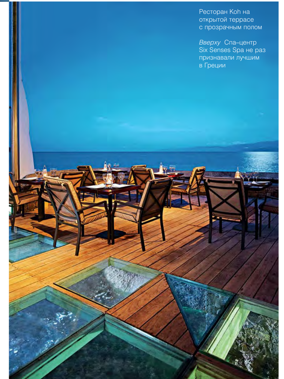
Ресторан Koh на открытой террасе с прозрачным полом