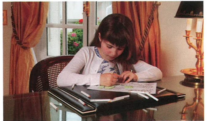
В Le Bristol Paris найдется занятие для любого ребенка!