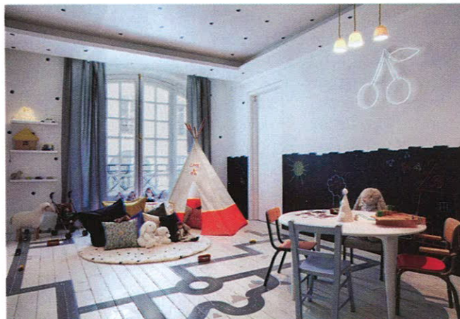
Детский клуб стал не только интереснее, но и красивее