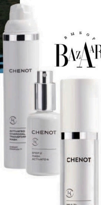
Маска Activated Charcoal Transforming Mask; активатор Step 2 Mask Activator; крем Multi-Performance Anti-Ageing Cream. Все Chenot.

Местный колорит здесь виден в каждой детали: отвечавший за облик Chenot Palace французский архитектор и дизайнер Мишель Жуанне использовал материалы из этого региона Азербайджана, от натурального камня и горной сосны до плитки в спа-зоне.