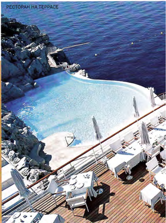
РЕСТОРАН НА TERRACE