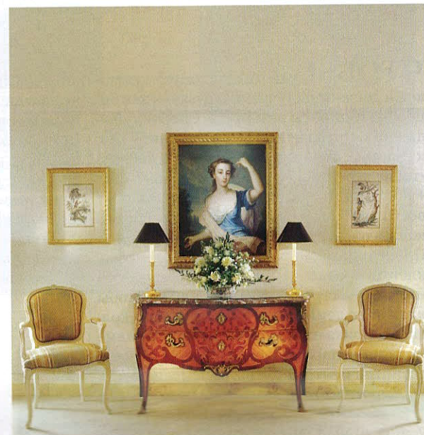
КАЖДЫЙ НОМЕР В LE BRISTOL СЛОВНО ОТДЕЛЬНАЯ ПАРИЖСКАЯ КВАРТИРА С ВИДОМ НА УЛИЦУ ФОБУР-СЕНТ-ОНОРЕ ИЛИ ВНУТРЕННИЙ САД ОТЕЛЯ

ИНТРИГИ ради можно сказать, что эти отели, входящие в число самых роскошных в Европе, своим процветанием обязаны пакетику с разрыхлителем для теста. Но это было бы большим преувеличением, хоть доля правды в этом определено есть. В середине прошлого века семья Эткер, чей успешный бизнес начался именно с продажи разрыхлителей, стала выкупать первоклассные европейские отели. Сегодня эти отели объединены под маркой Oetker Collection.