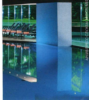
АРХИВ ПРЕСС-СЛУЖБЫ ИГРОУЛМЕС