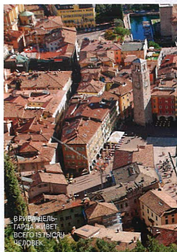
В РИВА-ДЕЛЬ-ГАРДА ЖИВЕТ ВСЕГО 15 ТЫСЯЧ ЧЕЛОВЕК

по городу с его мини-бастионом, базиликами и часовыми башнями – отличная идея на первый день. На второе утро завязывая кроссовки потуже и отправляясь на гору, в часовню Святой Варвары. С высоты 700 метров открывается умопомрачительный вид на озеро и альпийский хребет.