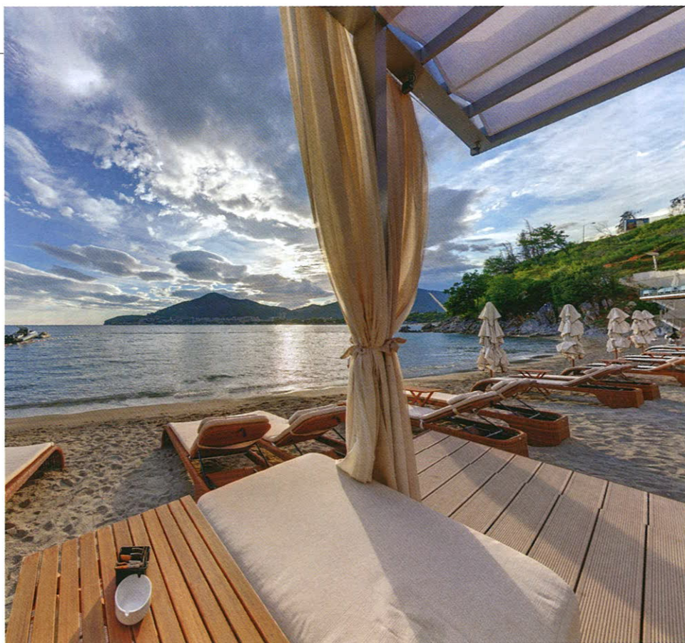
Moët & Chandon Beach

Какой пляж вы предпочитаете в это время суток? Главный песчаный Moët & Chandon Beach с одноименным баром? Или, может, уединенный VIP-пляж, где устраивают закрытые вечеринки и романтические свидания? Или же