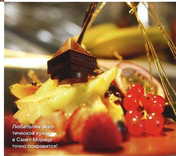
Любителям экзотической кухни в Санкт-Морице точно понравится!

НАДОЕЛА однообразная еда на горнолыжных курортах? Тогда вам в Санкт-Мориц – в Badrutt's Palace! В нем круглый год работают семь ресторанов, включая японский от Нобу Мацухисы, а после Нового года здесь появится и рор-ур кафе Le Pavillon, которое будет открыто до конца февраля. Заведение расположится в саду отеля и будет принимать лишь по 15 человек в день. Во второй зимний месяц мастера высокой кухни здесь будут готовить фондю, а в третий – блюда, «родом» из Индии. Кроме того, в январе в Санкт-Морице пройдет традиционный гастрономический фестиваль – в этот раз он соберет девять всемирно известных шефов, в числе которых будет и сам Нобу. Билеты уже в продаже, поторопитесь! www.badruttspalace.com