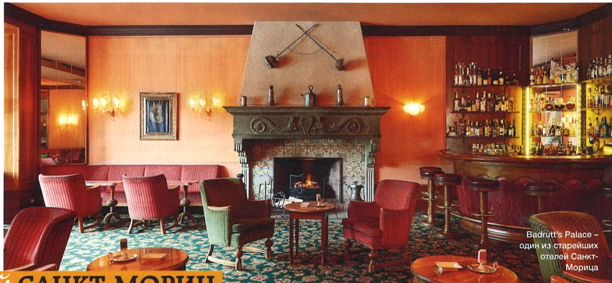
Badrutt's Palace – один из старейших отелей Санкт- Морица

ЕЩЕ ОДИН ПОВОД ПРОВЕСТИ ЗИМНИЕ КАНИКУЛЫ В САНКТ-МОРИЦЕ: ГОРНОЛЫЖНЫЙ СЕЗОН ЗДЕСЬ СОВПАДАЕТ С ГАСТРОНО- МИЧЕСКИМ!