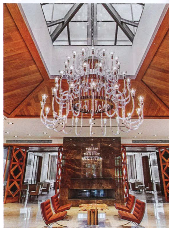
Отель похож на настоящий дворец!

Эти два месяца были сплошным кошмаром: каждый день, глядя на себя в зеркало, я видела, что все больше по- правляюсь, но совершенно не пони- мала, как остановить процесс. У меня