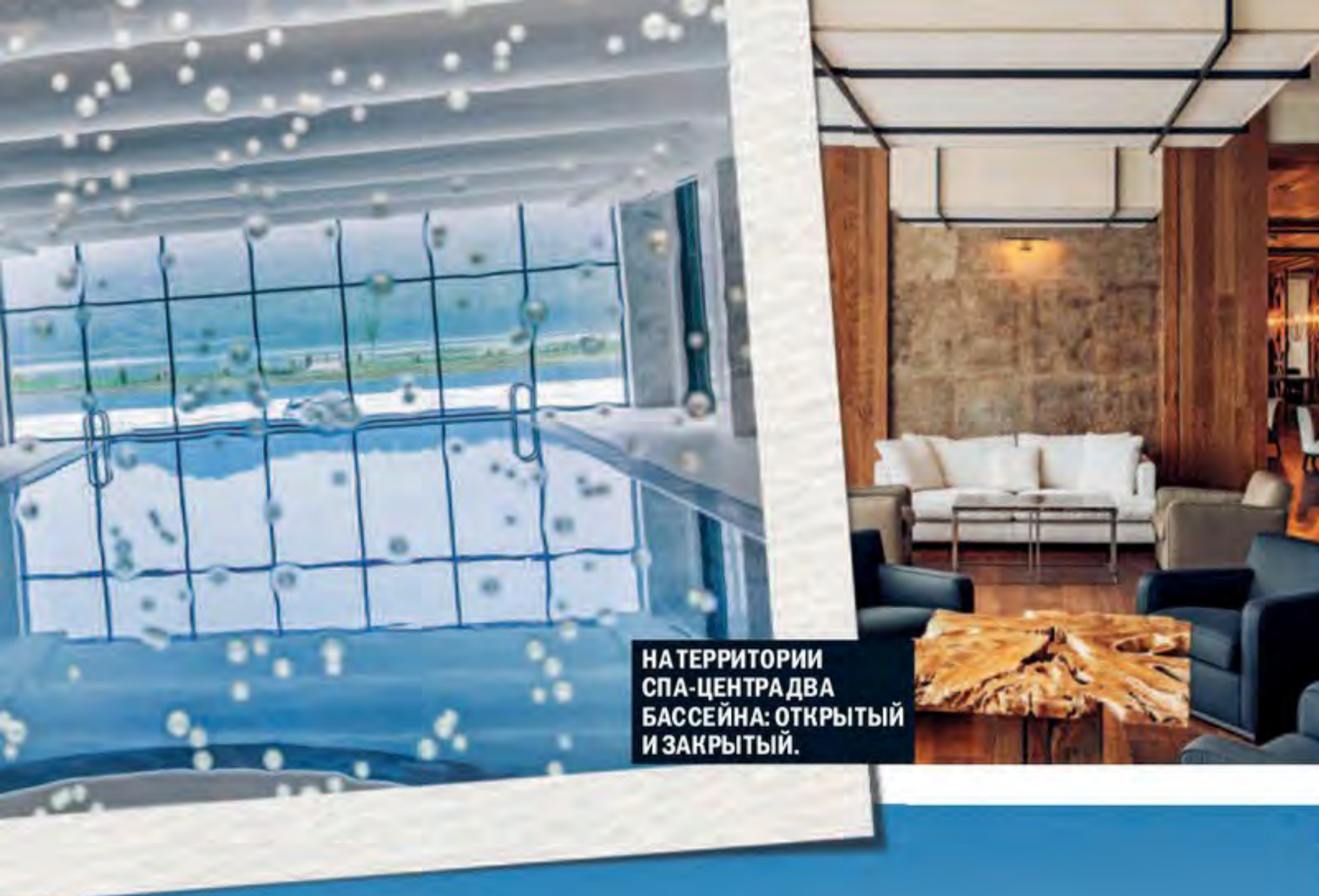
НА ТЕРРИТОРИИ СПА-ЦЕНТРА ДВА БАССЕЙНА: ОТКРЫТЫЙ И ЗАКРЫТЫЙ.