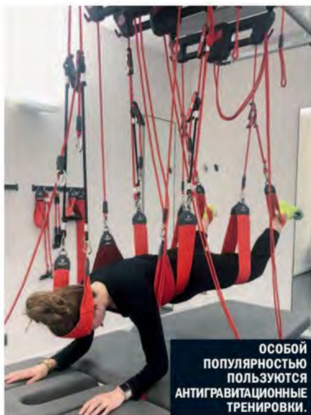
ОСОБОЙ ПОПУЛЯРНОСТЬЮ ПОЛЬЗУЮТСЯ АНТИГРАВИТАЦИОННЫЕ ТРЕНИРОВКИ.