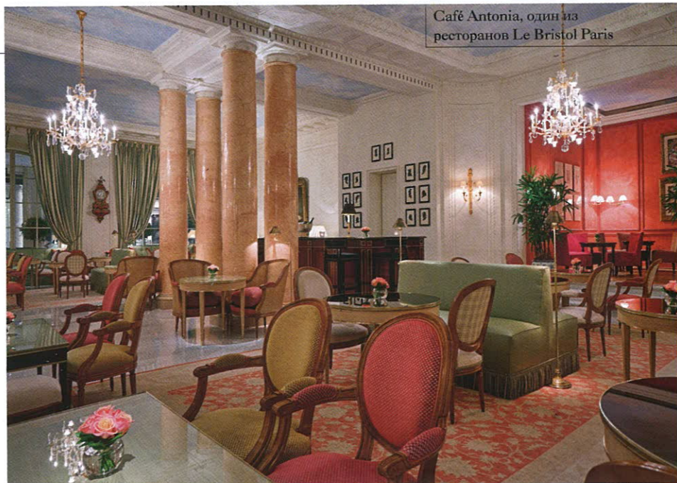
Сafé Antonia, один из ресторанов Le Bristol Paris

Специально к юбилею Эрик Фрешон разработал меню, в которое вошли его самые знаковые блюда. Это и черная икра из региона Солонь с муслином из подкопченного картофеля, и бресская пулярка в пузыре, и фаршированные черным трюфелем, артишоком и фуа-гра макароны. А чтобы насладиться вкуснейшим десертом – «дамскими пальчиками», пропитанными бурбонской ванилью и свежим имбирным соком, – стоит заглянуть в Café Antonia. MM