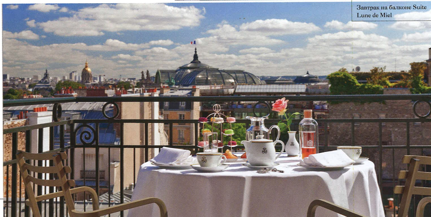
Завтрак на балконе Suite Lune de Miel