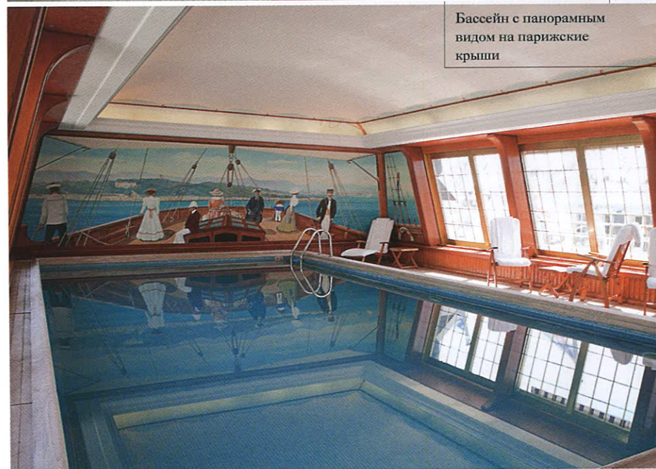
Бассейн с панорамным видом на парижские крыши