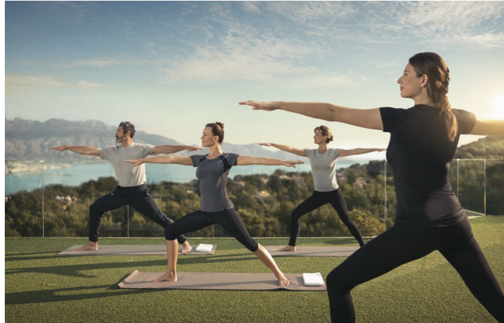
Йога на террасе отеля