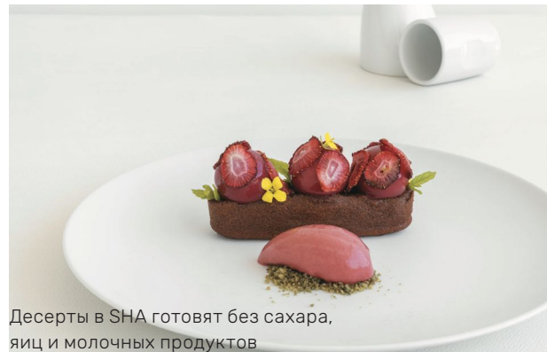
Десерты в SHA готовят без сахара, яиц и молочных продуктов