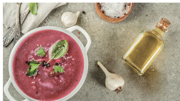
Свекольно-имбирный гаспачо SHA