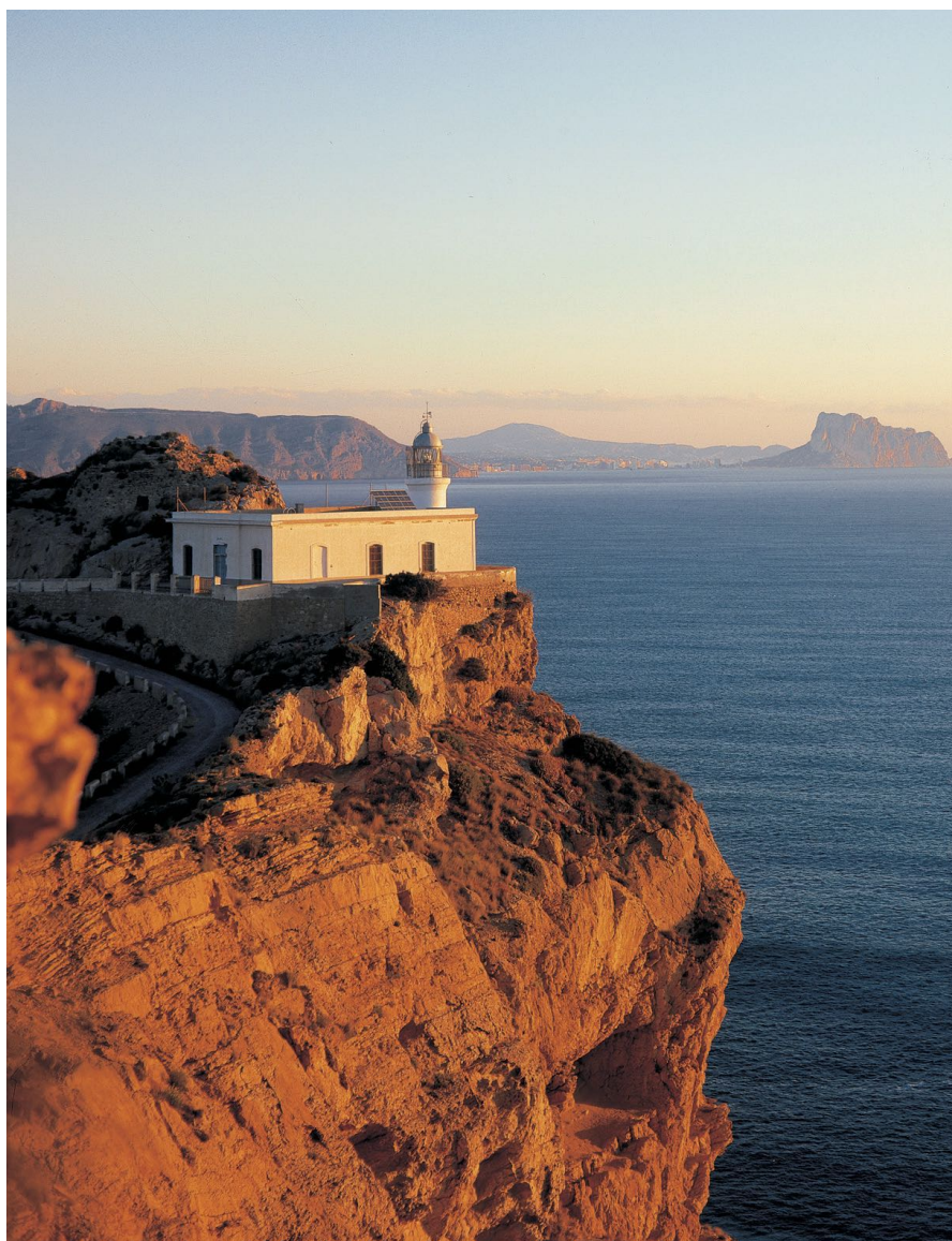
По утрам в SHA проходят прогулки к маяку

отеле используют энергосберегающие технологии, организуют мероприятия по восстановлению лесов, поддерживают биодинамическое земледелие. В общем, всеми силами поддерживают идею устойчивого развития. Все это позволило SHA получить престижную премию в области устойчивого туризма Green Globe.