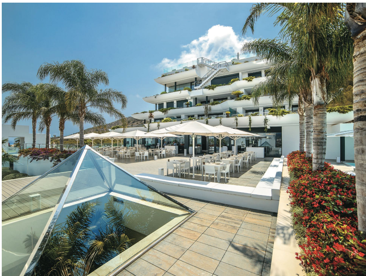
Терраса отеля на верхнем этаже