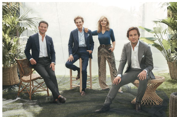
Семья Батальер - основатели и владельцы SHA

В своих будущих проектах SHA также планируют придерживаться данного направления. Так, в 2023 году планируется открытие SHA Wellness Clinic в Мексике, на Плайя-Мухерес. Отель будет расположен в тихом месте напротив острова Исла-Мухерес, в 30 минутах от международного аэропорта Канкуна. Территория нового отеля будет включать в себя 7 гектаров живой природы и пляж с белым песком длиной около полукилометра. Гости нового SHA смогут увидеть знаменитый Мезоамериканский барьерный риф. В том же году новый SHA откроется и на Ближнем Востоке, в районе-заповеднике Аль-Джурфе между Дубаем и Абу-Даби. Общая территория SHA Emirates займет в общей сложности 125 000 квадратных метров вдоль побережья Ривьеры. В отеле будет 120 номеров и suites, а также каскадные висячие сады и панорамный вид на побережье. И, как и в Аликанте, в новых SHA большое внимание будет уделено бережному отношению к природе и минимизации негативного воздействия на нее.