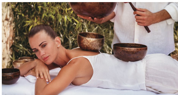
Процедура с тибетскими чашами