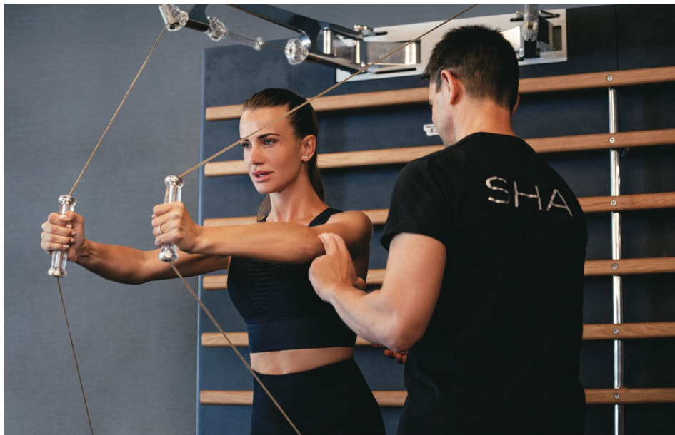
В SHA прекрасно оборудованный спортзал