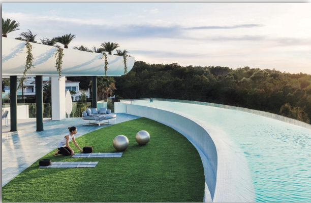
На территории SHA Residences можно заниматься спортом

SHA – ЭТО НЕ ПРОСТО КЛИНИКА, И НЕ ПРОСТО ПЯТИЗВЕЗДОЧНЫЙ ОТЕЛЬ. ЭТО ЦЕНТР, ГДЕ СОЕДИНИЛИСЬ ПОСЛЕДНИЕ ДОСТИЖЕНИЯ ЕВРОПЕЙСКОЙ МЕДИЦИНЫ, ТРАДИЦИОННЫЕ ОЗДОРОВИТЕЛЬНЫЕ ВОСТОЧНЫЕ ПРАКТИКИ, ГАСТРОНОМИЯ, ДИЗАЙН И СЕРВИС ВЫСОЧАЙШЕГО УРОВНЯ. НО ОБО ВСЕМ ПО ПОРЯДКУ.