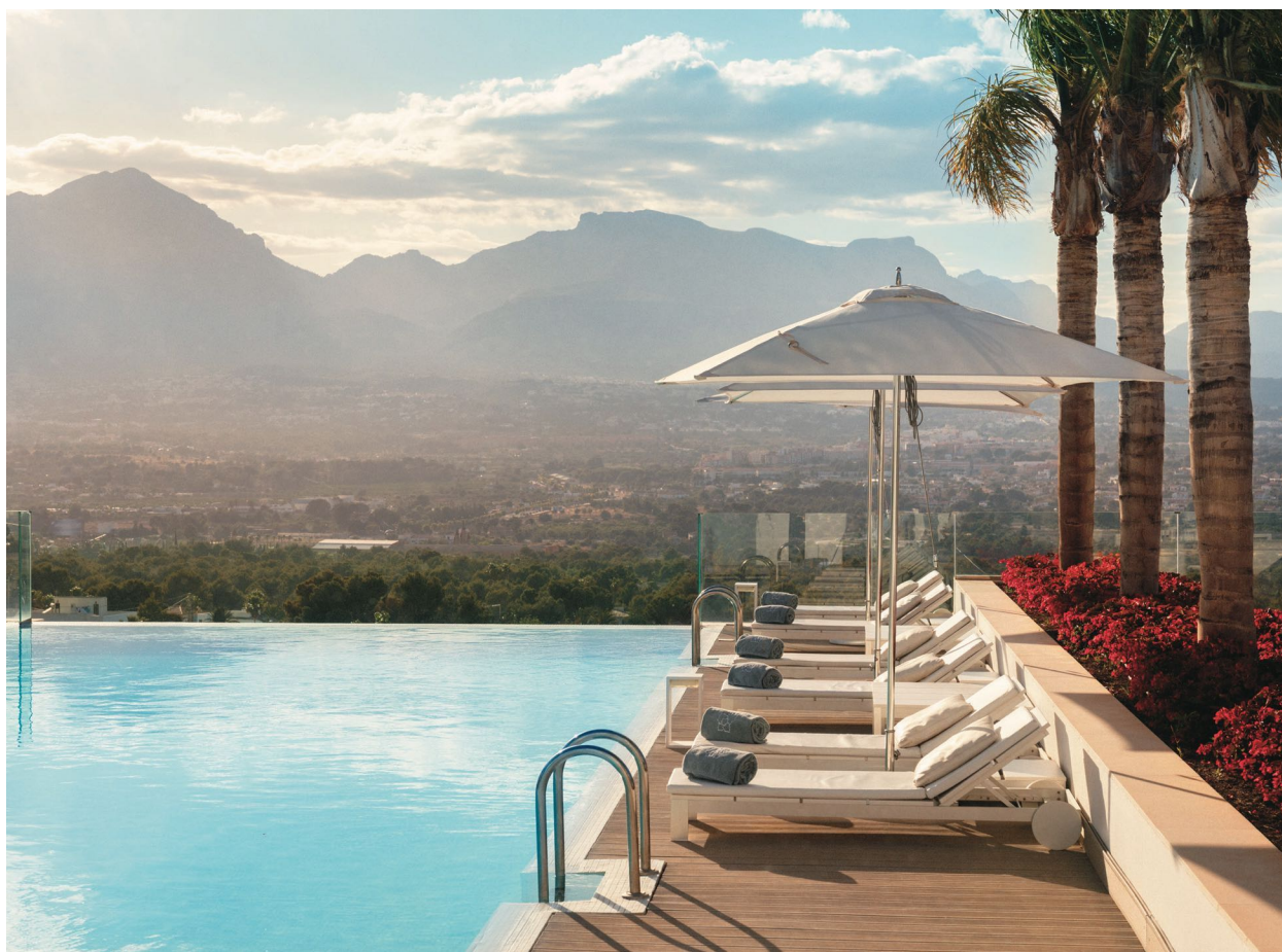
Infinity бассейн на крыше отеля

Начинается все с места, где находится отель — в 15 минутах прогулки от моря, в окружении природного парка Сьерра-Эллада. Местный микроклимат признан ВОЗ одним из лучших для здоровья в мире. По утрам в SHA устраивают групповые трекинги на ближайшую гору и к маяку. Маршрут достаточно простой, но все же достаточно интенсивный. Попробовать стоит обязательно — виды, которые откроются вам по пути, точно запомнятся на всю жизнь. А энергии после такой утренней прогулки хватит на весь день. В SHA вообще такая атмосфера, что хочется много двигаться, гулять, заниматься йогой и спортом. И тут для этого есть все возможности: небольшой, но хороший современный спортзал с высокопрофессиональными тренерами, возможность брать частные уроки йоги и т.д., и вот такие организованные походы.