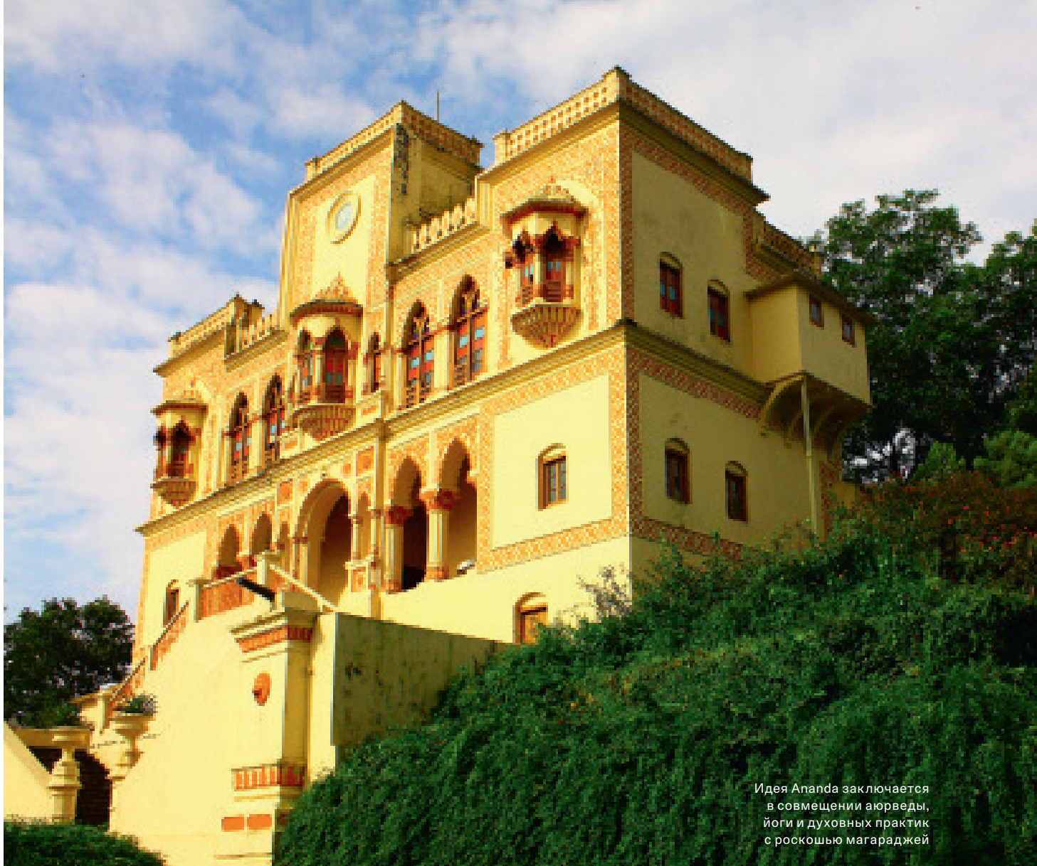
Идея Ananda заключается в совмещении аюрведы, йоги и духовных практик с роскошью магараджей

после дня шопинга и музеев, поспать в массажном кабинете, понежиться в ванне с лепестками роз, в общем, понюхать аюрведу – в прямом и переносном смысле – иди в гостиничное (к тому же Оберою) SPA в Джайпуре или Агре. Эти прекрасные заведения – не про врачей и терапию, они про полное расслабление и абсолютно честный отъем денег у богатых постояльцев.