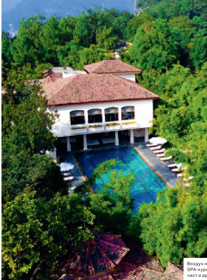
Воздух на этом SPA-курорте всегда чист и ароматен