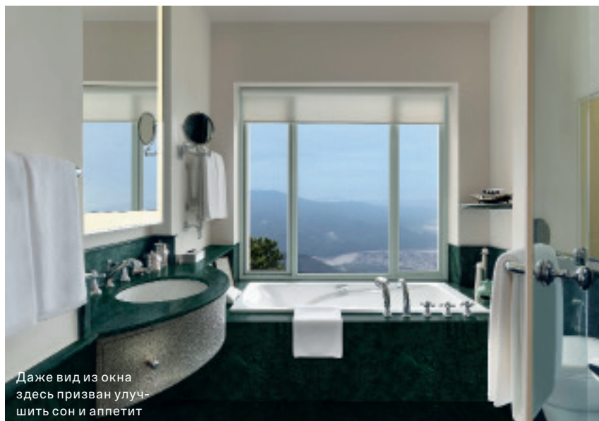
Даже вид из окна здесь призван улучшить сон и аппетит

Bukhara оказалась заведением абсолютно выдающимся: все последующие приезды в Дели я стал приходить в этот ресторан, чтобы снова съесть баранью лопатку и лобстера из тандыра.