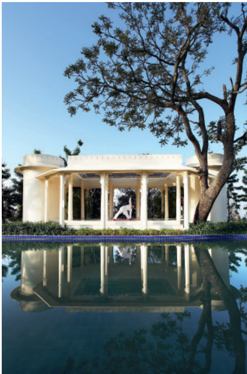
На санскрите и в индуистской философии «ананда» означает «блаженство»

В чем разница? Ну хотя бы в том, что на юге, в Керале, гламур и роскошь принципиально, как церковь от государства, отделены от лечения. Хочешь что-то в себе подправить – похудеть, улучшить сон, почистить организм – страдай! Ходи в больной пижаме, ставь клизмы, голодай, сиди за забором, не пользуйся благами цивилизации. И так – три недели. Или наоборот: мечтаешь размять кости