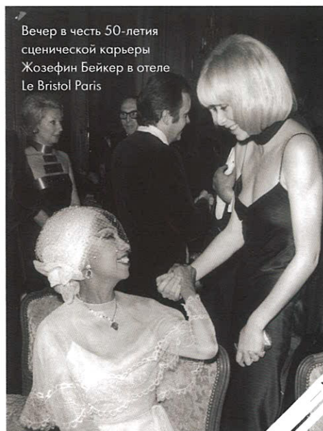
Вечер в честь 50-летия сценической карьеры Жозефин Бейкер в отеле Le Bristol Paris