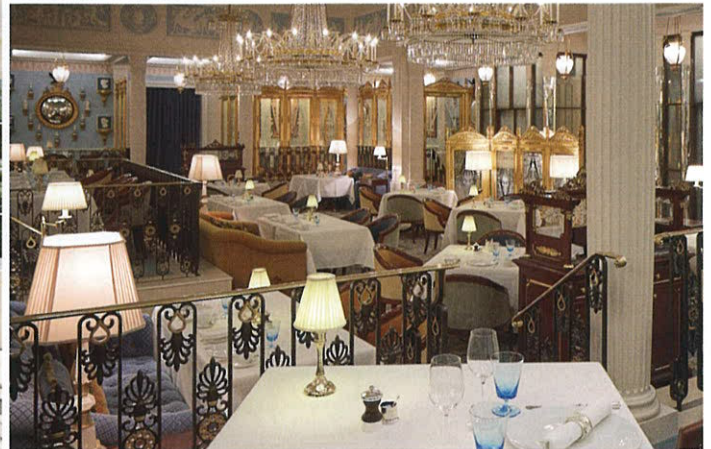
В историческом районе Вестминстер отель The Lanesborough свой среди своих: Гайд-парк, Букингемский дворец и Биг-Бен – прекрасные соседи

В 1733 году изобрели челнок для выделки сукна, в России императрица Анна Иоанновна заложила Петропавловскую крепость, а в Лондоне группа медиков взяла в аренду здание, на тот момент уже принадлежавшее семейству Гросвенор, чтобы устроить Больницу святого Георгия. Работа больницей может довольно сильно износить любое строение, и в 1825 году за его реконструкцию взялся знаменитый Уильям Уилкинс, автор проекта Лондонской национальной галереи и большой поклонник неоклассицизма. В итоге здание получило еще один этаж, новое крыло, обновленный фасад, галерею на первом этаже и весьма изящные лестницы. В таком виде больница проработала больше ста лет, а после Второй мировой войны ее стали распределять по новым местам.