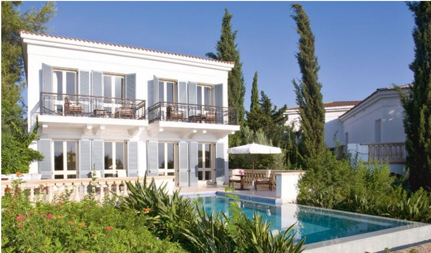
1. Вилла Alexandros

2. В Anassa постарались создать антураж средиземноморской деревушки: белые стены, черепичные крыши, природный камень и дерево в оформлении