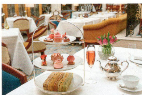
Послеобеденное чаепитие в The Lanesborough – обязательный пункт лондонской программы