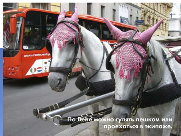
По Вене можно гулять пешком или проехаться в экипаже.