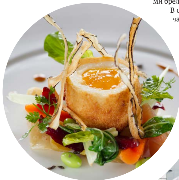
Отельный ресторан Le Saint-Martin имеет одну звезду Michelin

В убранстве отеля много гобеленов и обюссонских ковров, которые с ренессансных времен покрывали полы