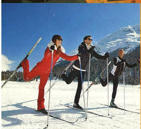
В отеле есть школа катания, прокат и магазин лыжной экипировки

Останавливаться лучше всего в Badrutt's Palace Hotel, постройке 1896 года с панорамным видом на Энгадинские Альпы и озеро Санкт-Мориц (до которого от дверей здания всего 300 метров). В отеле есть три ресторана, бар, свой старинный винный погреб, открытый и крытый бассейны, оздоровительный комплекс, парикмахерская, тренажерный центр, зал для йоги, детский клуб, лыжная школа – в общем, все для того, чтобы гости не выходили за территорию! Тут же на месте первого в Европе крытого теннисного корта заработал ресторан знаменитого японского шеф-повара Нобуюки Мацухиса – Matsuhisa@Badrutt's Palace. В основе философии нового заведения – гармоничное сосуществование лучших традиций и техник японской и перуанской кухонь. И это еще один повод, чтобы выбраться на отдых именно сюда! ☺