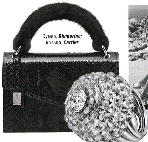
Сумка, Blumarine ; кольцо, Cartier