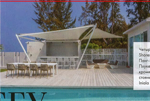
Четыре виллы Iniala Shores в провинции Панг-Нга, к северу от Пхукета, стоят у самой кромки волны и на расстоянии 400 м от отеля Iniala Beach House

Обитатели мегаполисов ощущают недостаток приватности. Неудивительно, что персональные виллы с частным пляжем и полным комплексом гостиничных услуг выглядят особенно притягательно. Так, бутик-отель Iniala Beach House прибавил к своим трем виллам еще 4 новые – Iniala Shores, построенные на расстоянии около полукилометра. В каждой – от 2 до 5 спален, бассейн и спа-кабинет. Завтраки и ланчи сервируются на вилле, на ужин можно заказать барбекю из морепродуктов или «тайский банкет» у своего бассейна ($1675-6500; iniala.com ).