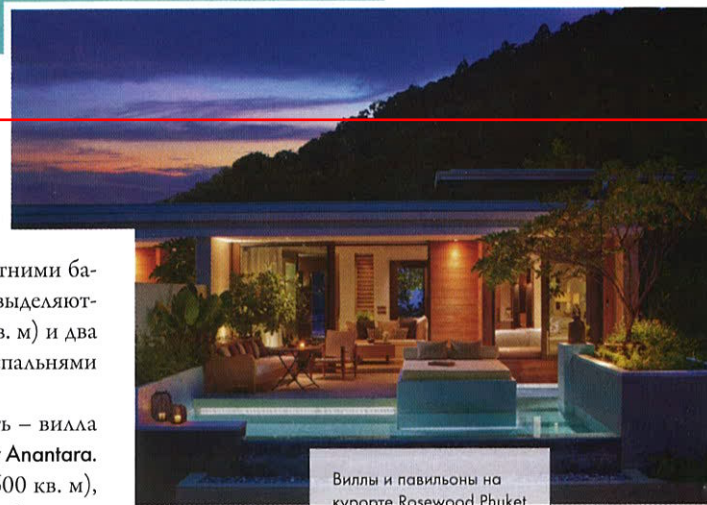
Виллы и павильоны на курорте Rosewood Phuket готовятся принять первых гостей в конце года

Но, пожалуй, самая яркая новость – вилла Similan в комплексе Layan Residences by Anantara. Это целое имение с 8 спальнями (3600 кв. м), спортзалом, кинотеатром, винотекой, бильярдной, полноценной спа-зоной и интерьерами, украшенными антиквариатом и коллекцией искусства. Над бухтой Лаян его возвел знаменитый индонезийский архитектор Джая Ибрагим. Каскады фонтанов, 20-метровый бассейн с массажной системой, отделанный натуральным зеленым камнем, и антикварная тиковая дверь из Бирмы на главном входе дополняют впечатление (от $6954; phuket-layan.anantara.com ). ■