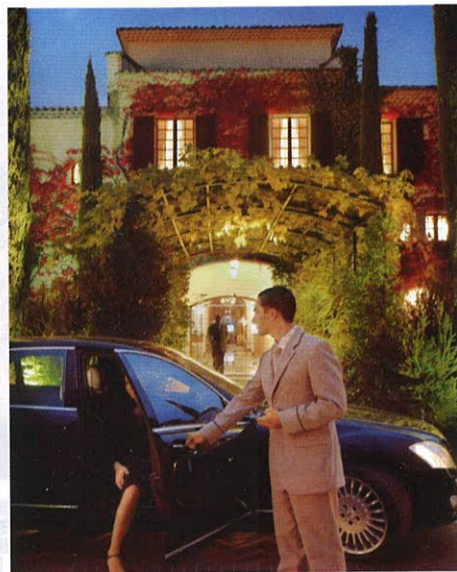
Окрестности отеля – Приморские Альпы и муниципалитет Сен-Поль-де-Ванс – стоят того, чтобы их рассмотреть. Удобней всего это сделать, арендовав автомобиль